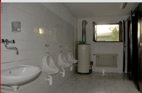
sociální zařízení pro muže