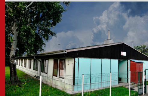
Azylový dům v Břeclavi pro muže a ženy