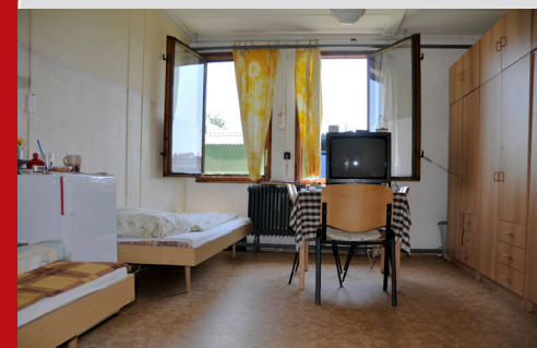
pokoj pro naše klienty