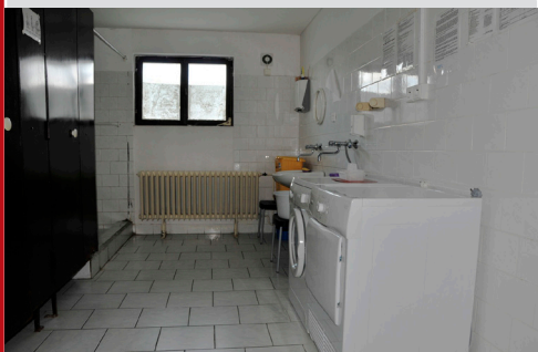
sociální zařízení pro ženy